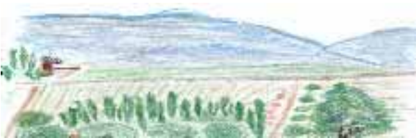
Le dessin remplace la photo qui nous manque