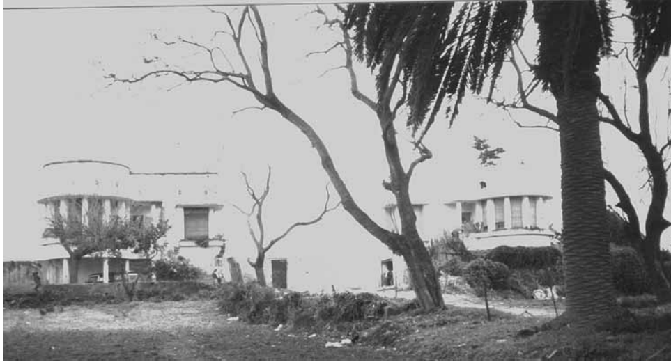
Les villas jumelles vues de la route Koléa-Castiglione