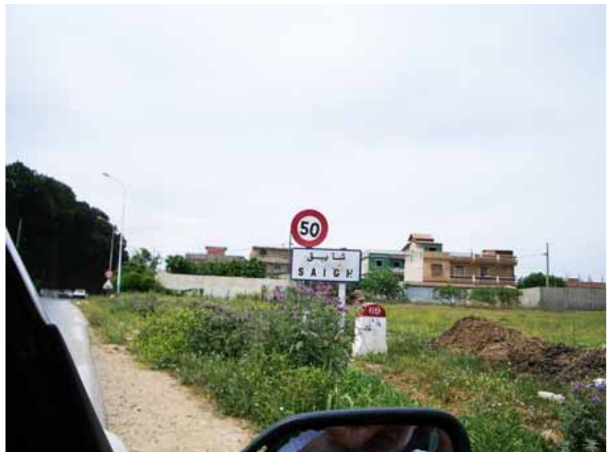
Arrivée sur Saighr en venant de Castiglione

C'est sur cette route et dans cette descente que les jeunes réalisaient leurs courses avec les carrioles.