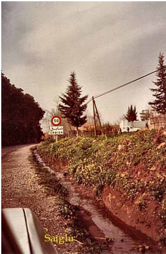
Arrivée sur Saighr en venant de Koléa