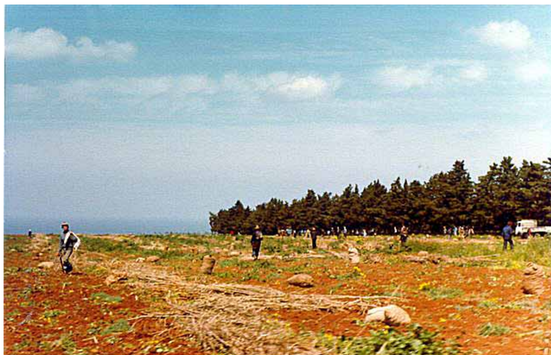
En avril 1980, le ramassage des pommes de terre à l'ancienne ferme Parra. Dans le fond, la mer .